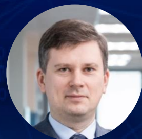
Евгений Абакумов Госкорпорация «Росатом»

Итоги ЦИПР от лидеров инновационного развития компаний, инвестирующих в цифровую трансформацию.