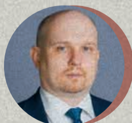
ДМИТРИЙ СМИТ президент, Федерации компьютерного спорта России