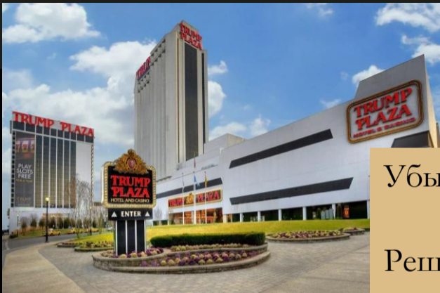
Trump Plaza Атлантик-Сити, 1992