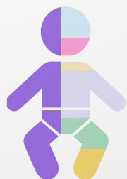
1 месяц - 3 года