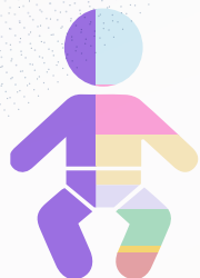
1 месяц - 3 года