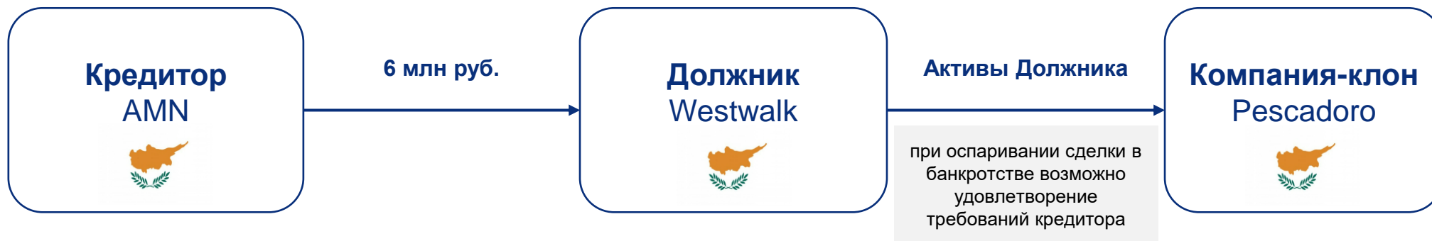
Схема определения тесной связи должника с РФ