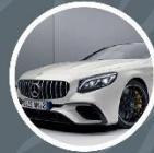
MERCEDES-BENZ S 63 AMG