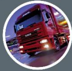
IVECO EUROSTAR LD 440