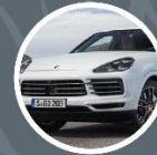
PORSCHE CAYENNE TURBO