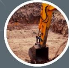
УЧАСТОК ПОД ЗАСТРОЙКУ