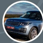
LAND ROVER RANGE ROVER